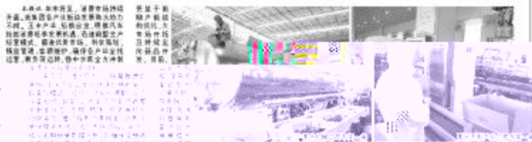
我集团开足马力忙生产，奋力冲刺全年目标任务。图中展示了工厂内部繁忙的生产场景，工人们正在操作大型工业设备，生产线上物料流转迅速。

本报讯 近年来，随着“双碳”目标的提出，钢铁行业正经历深刻变革。我集团紧跟时代步伐，加大研发投入，提升产品质量，为高质量发展注入强劲动力。 作为钢铁行业龙头企业，我集团始终坚持以科技创新为驱动，不断提升自主创新能力。通过引进先进技术和人才，不断优化生产工艺，提高生产效率和产品质量。同时，我们还积极响应国家号召，加大环保投入，推动绿色制造，实现经济效益和社会效益的双赢。 在激烈的市场竞争中，我集团始终保持敏锐的洞察力和强大的执行力。通过精准的市场定位和灵活的营销策略，我们成功开拓了国内外市场，赢得了广大客户的认可和信赖。未来，我们将继续秉承“质量第一、客户至上”的经营理念，不断提升核心竞争力，为实现高质量发展目标而努力奋斗。